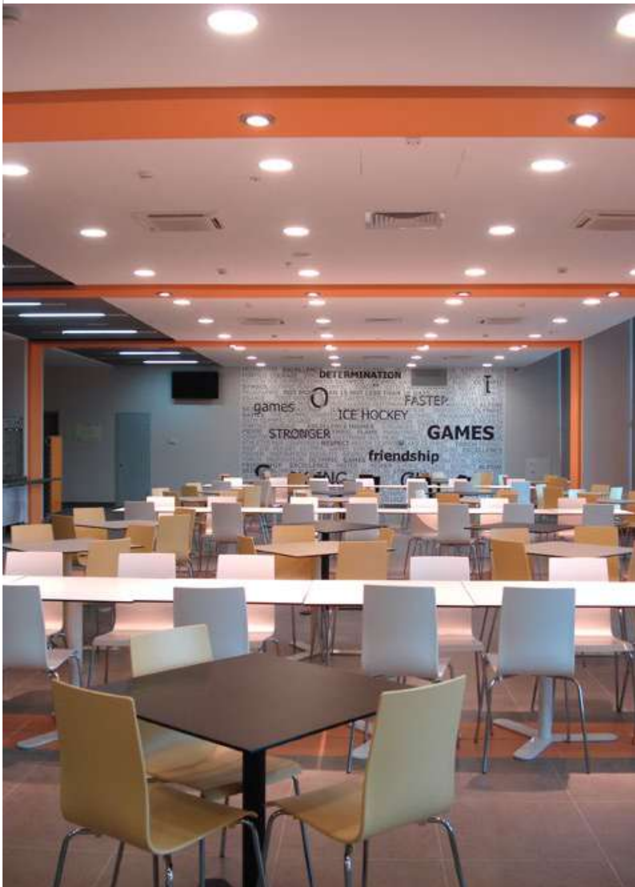
Projekat: Ruski međunarodni olimpijski centar Lokacija: Soči, Rusija Materijal: FUNDERMAX Max Interior Compact Dekor: 0085 FH Bela