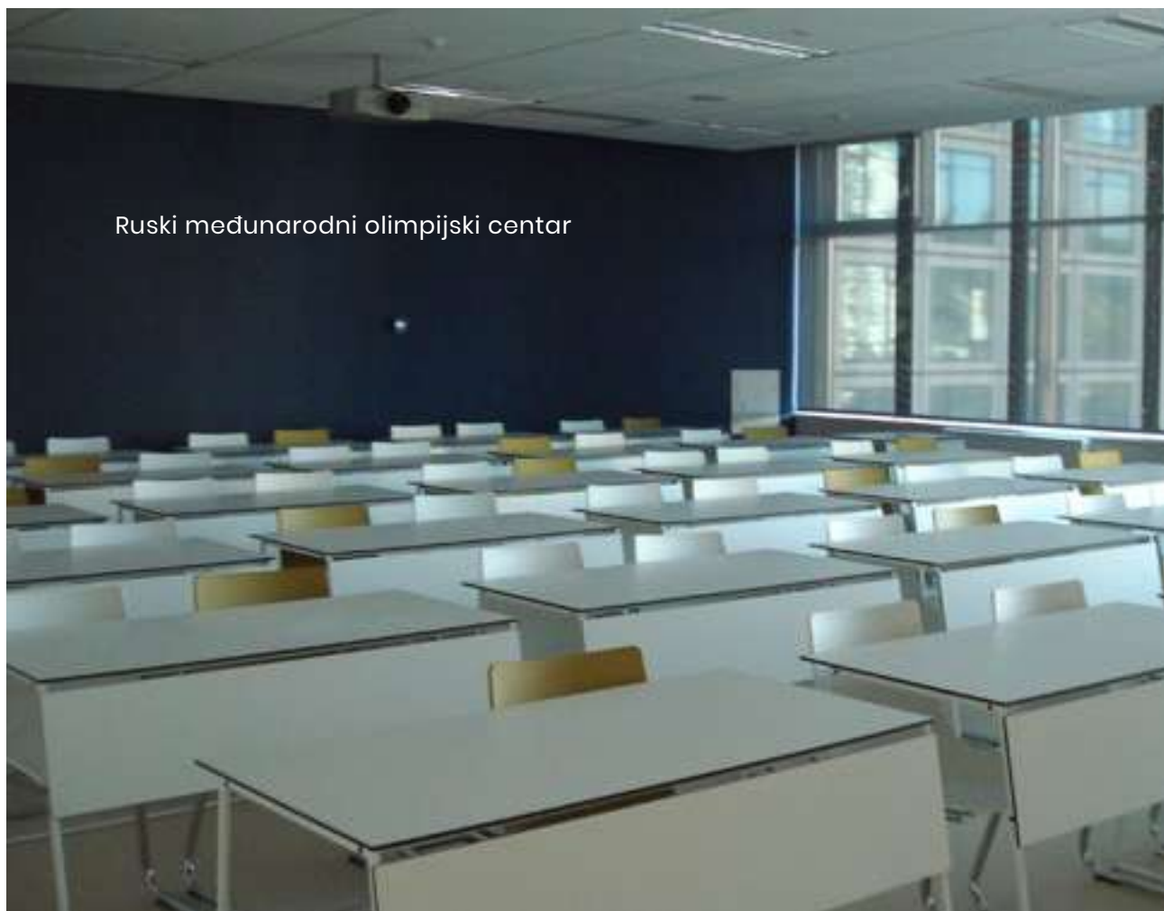
Ruski međunarodni olimpijski centar