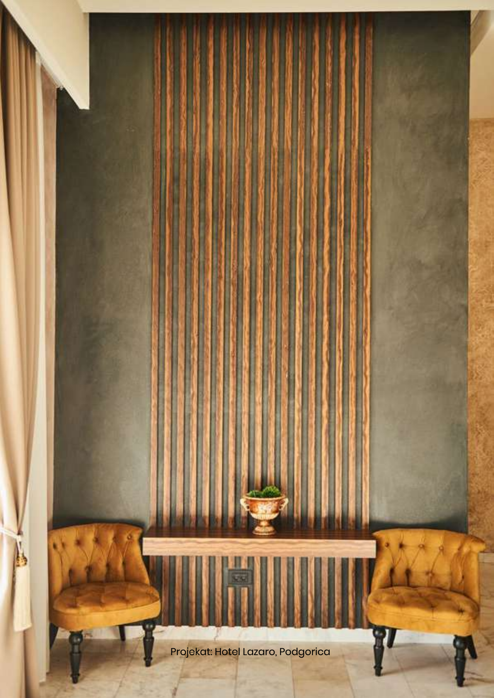
Projekat: Hotel Lazaro, Podgorica