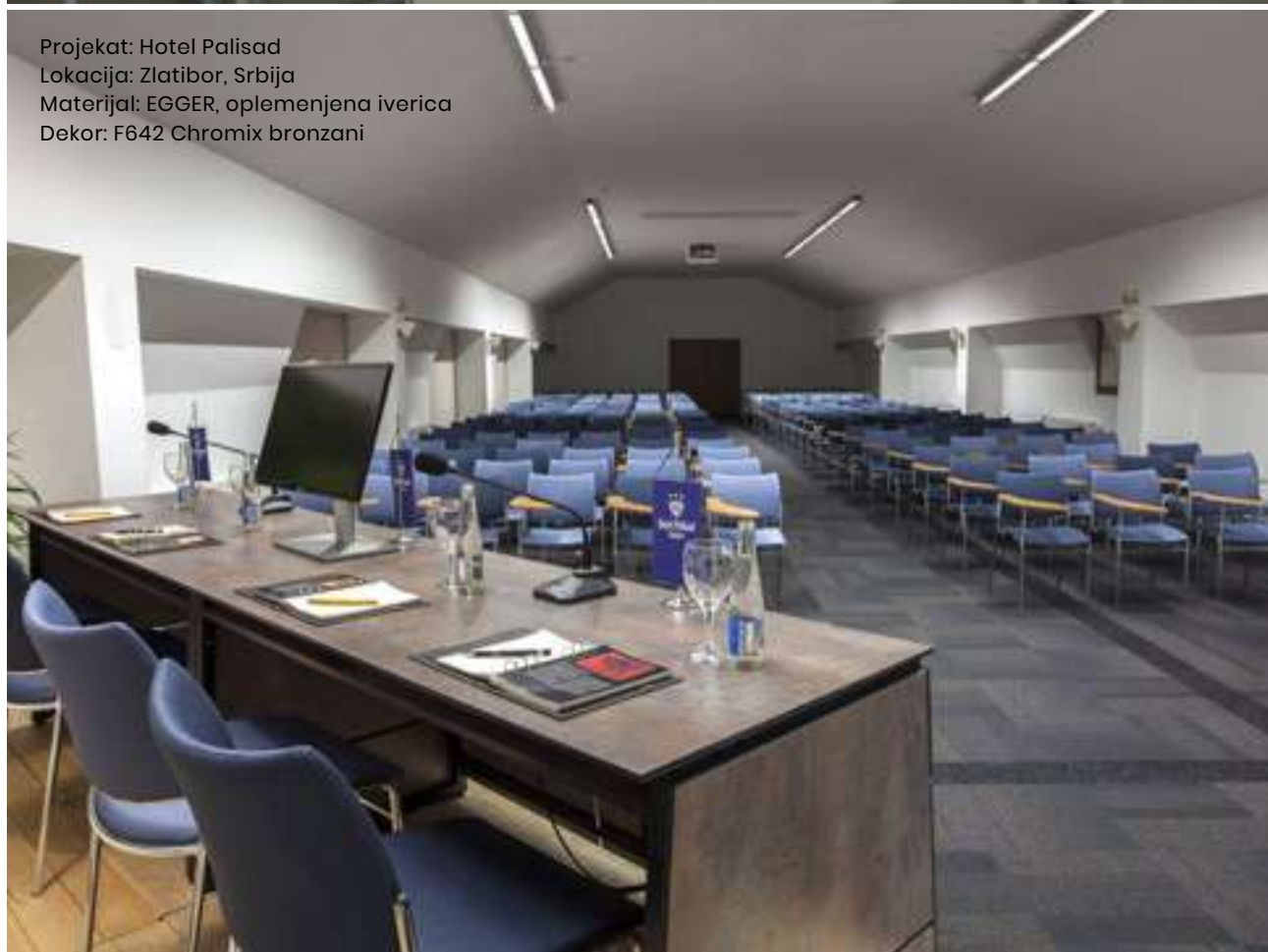
Projekat: Hotel Palisad Lokacija: Zlatibor, Srbija Materijal: EGGER, oplemenjena iverica Dekor: F642 Chromix bronzani