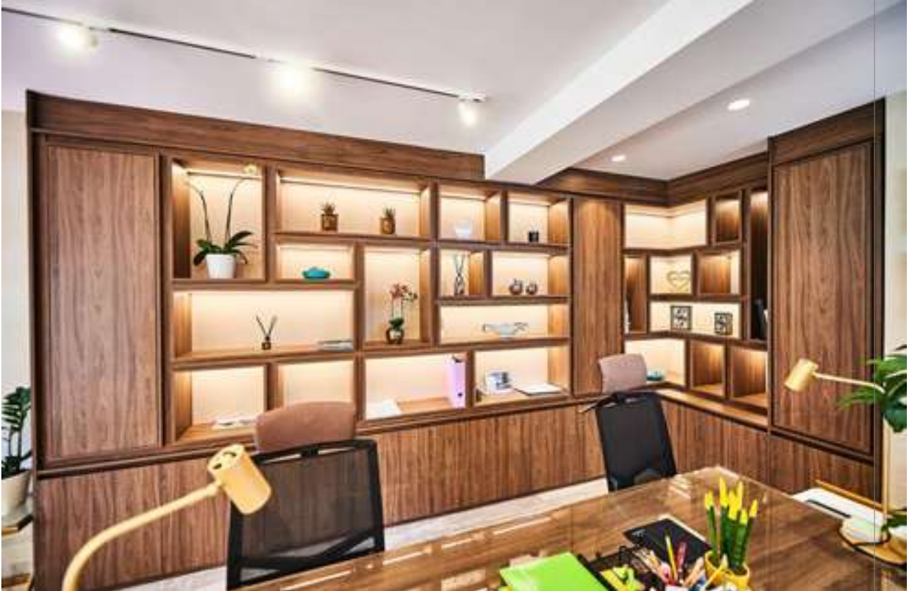
Projekat: Enterijer poslovnog prostora MONTESUN GROUP DOO Dizajn: Marija Mitrović - Design by Maria Lokacija: Budva, Crna Gora Materijal: EGGER oplemenjena iverica, Dekori: H3710 ST12 ,F416 ST10.